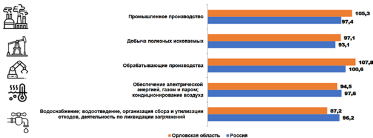
Рис. 1 Индексы производства за 2020 год

В экономике Орловской области агропромышленный комплекс занимает особое место. Производство зерна на душу населения составляет 2,94 тонны (самый высокий показатель в Центральном федеральном округе).