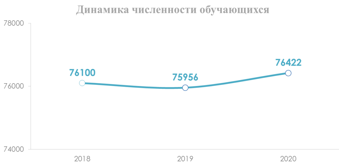
Рис. 2 Динамика численности обучающихся в общеобразовательных организациях Орловской области

На протяжении последних двух лет прослеживается тенденция увеличения количества обучающихся в общеобразовательных организациях области. С 2019 года число обучающихся возросло на 466 человека (рис. 2).