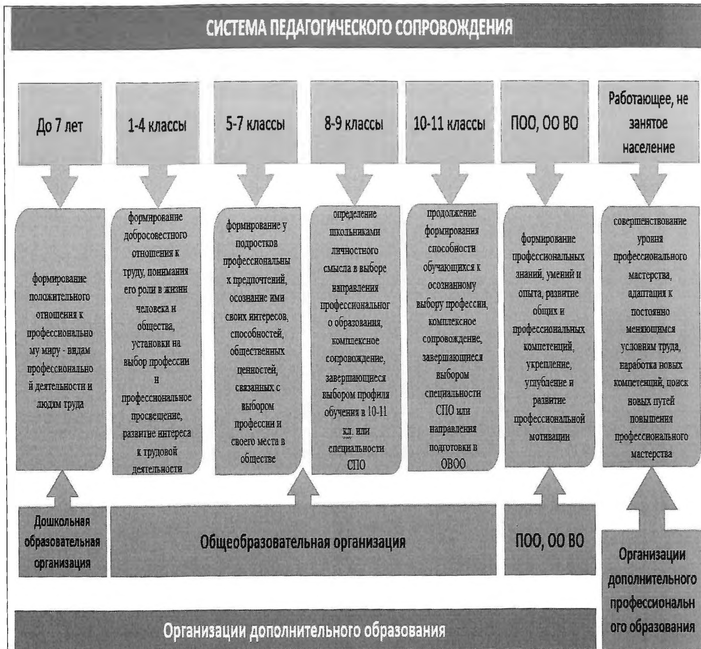
Рис. 2 Модель педагогического сопровождения профессионального самоопределения обучающихся

трудоустройству по выбранной профессии выпускников образовательной организации.